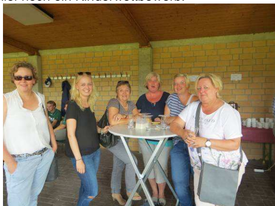
Auch die Damen hatten ihr Vergnügen

Beim diesjährigen Dorfpokal am 1.8. hatten 7 Mannschaften gemeldet: Teakwon Tatze, Uffelner Jungs, Lovers Lane, Flüddert Killers, Flüddert, Dynamo Tresen und das weiße Ballett. Bei ansprechendem Besuch und bestem Wetter kämpften sie um den Pokal. Für die Kleinen war eine Hüpfburg aufgebaut und es lief noch ein Kinderwettbewerb.