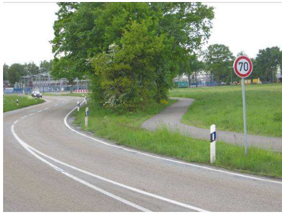
Trennung durch Grünstreifen