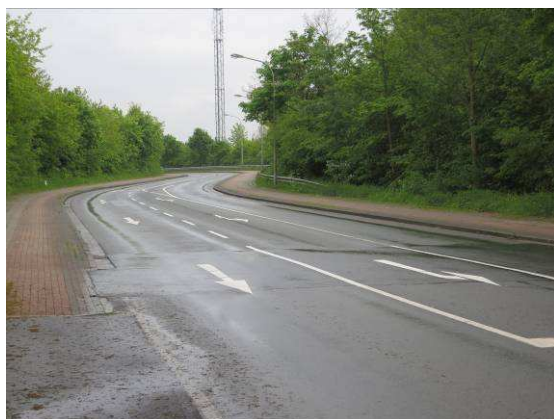
Trennung durch unterschiedliche Pflasterung

Für andere Verkehrsteilnehmer als Radfahrer lösen auch solche Radwege ohne Benutzungszwang ein Benutzungsverbot aus. Sie dürfen sie z. B. nicht befahren oder auf ihnen parken.