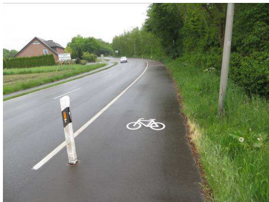
Trennung durch einfache Fahrbahnbegrenzung mit dahinter stehenden Leitpfosten