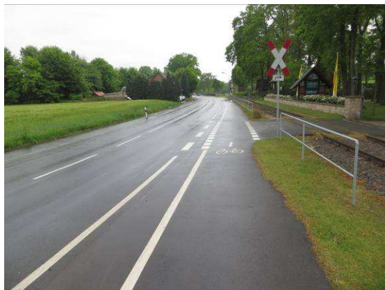
Trennung durch doppelte Fahrstreifenbegrenzung