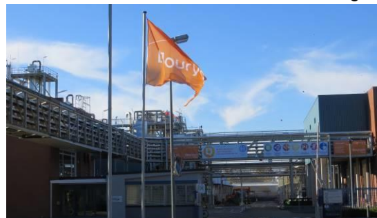
An der Hauptstr. steht zwar noch das Firmenschild von AkzoNobel, aber an der Werkseinfahrt weht bereits die Fahne von Nouryon.

Die neue Anlage sichert den Standort und damit die Arbeitsplätze.