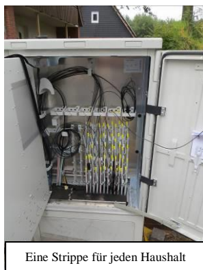
Eine Strippe für jeden Haushalt

In letzter Zeit sieht man sie seltener, die Arbeitskolonnen des polnischen Tiefbauunternehmens und die Techniker der niederländischen Kabelbau-Firma. Es hat den Anschein, dass die Tiefbau- und Montagearbeiten des Glasfaserausbau in Uffeln für die Deutsche Glasfaser und nachfolgend für Osnatel weitestgehend abgeschlossen sind. Inzwischen wurden auch fast alle Baugruben geschlossen und aufgerissene Straßen und Radwege ausgebessert.