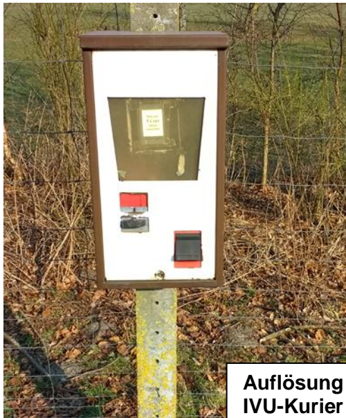
Auflösung IVU-Kurier Nr.17