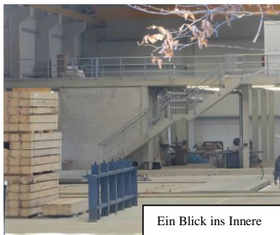
Ein Blick ins Innere

Verdeckt durch Erdwälle und Bäume wächst Am Barbarastollen die große Halle der Fa. Gilne heran. Ist schon imposant.