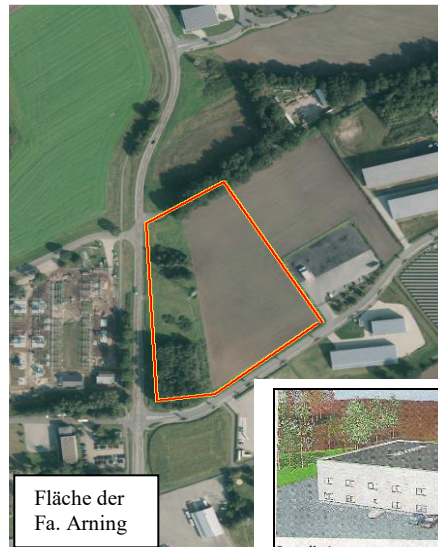
Fläche der Fa. Arning

Aus 17 Mitarbeitern besteht derzeit das Team von Arning. Es ist aber noch Platz für weitere, so Arning in der IVZ. Gesucht sind gelernte Maschinenbauer, aber auch Azubis.