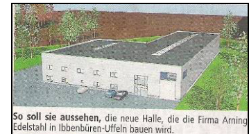
So soll sie aussehen, die neue Halle, die die Firma Arning Edelstahl in Ibbenbüren-Uffeln bauen wird.