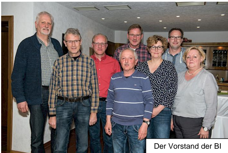
Der Vorstand der BI

Der Vorstand der Bürgerinitiative hat beschlossen, einer außerordentlichen