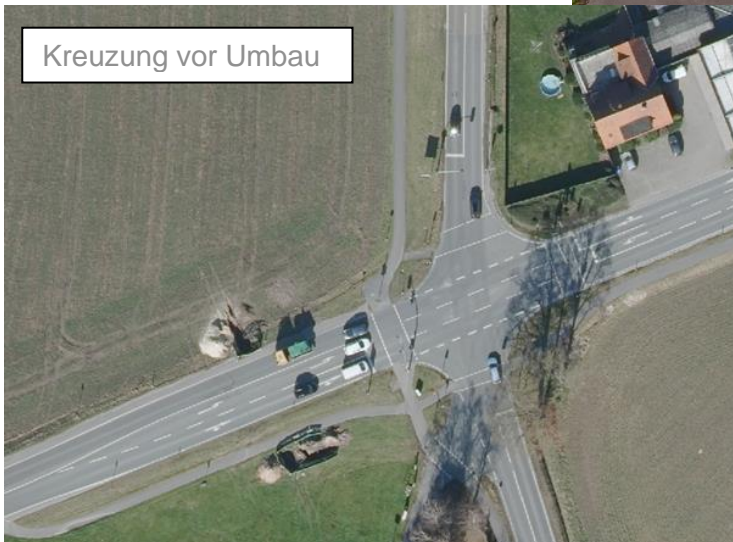
Kreuzung vor Umbau

zukünftige Verlauf des Radweges Richtung Hörstel bis zur Kanalrampe bereits erkennbar. Auch auf der Tankstellenseite gibt es kleine Verbesserungen. Auf der nördlichen Seite ist jetzt zusätzlich ein kurzer Radweg angelegt worden. Über ihn kann man von der Kreuzung aus als Fußgänger oder Radfahrer das Tankstellengelände erreichen oder verlassen, ohne die Straße überqueren zu müssen. Eine neue