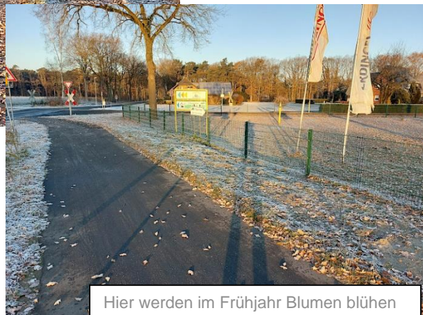
Hier werden im Frühjahr Blumen blühen

Die neuen Eichen stehen zwischen dem Radweg und der Fahrbahn Uffelner Weg und geben dem Radweg immer mehr den Charakter einer Allee. Die Pflege der Bäume, einschließlich der ggf. notwendigen Bewässerung, übernimmt